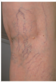
Gambar : Vena Laba-laba (Spider Vein)