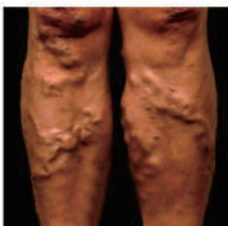
Gambar : Varises

Varises adalah keadaan dimana pembuluh darah vena yang dekat dengan permukaan kulit menjadi membesar dan berkelok-kelok. Hal ini biasanya timbul pada kaki.